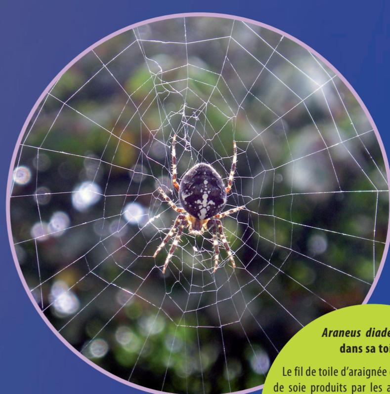
Araneus diadematus dans sa toile.

Les études de la composition chimique des os et de l'émail dentaire ont été assez déroutantes pour les premiers chercheurs. Ces composés chimiques sont des nanocristaux très réactifs nommés apatites. Par une bio-minéralisation artificielle l'homme crée des prothèses cristallines qui imitent la nature.