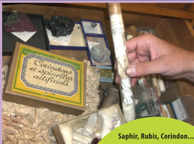
Saphir, Rubis, Corindon...

Les cristaux de corindon, saphir ou rubis sont cultivés (on dit cristallisés) à très haute températures en faisant tomber de la poudre d'alumine dans une flamme, un procédé industriel découvert par Verneuil en 1902. Ces cristaux faits par l'Homme sont aussi parfaits que ceux faits dans la nature. Ce procédé industriel est utilisé pour faire des bijoux à moindre coût, mais actuellement en Europe, il est surtout utilisé pour réaliser les verres in-rayables des montres de luxe ou des supports de circuits du futur.