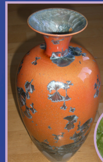
Décor à base de cristaux de Wavelite.