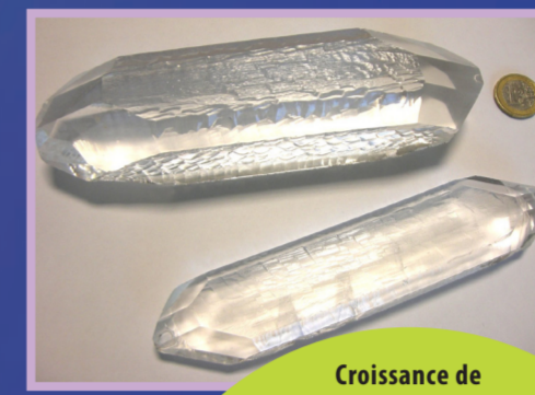
Croissance de cristaux par l'Homme

Ce temps peut-être très variable en fonction de chaque matériau. Si vous voulez choisir entre une gerbe de petits cristaux ou quelques gros cristaux ajoutez du temps !