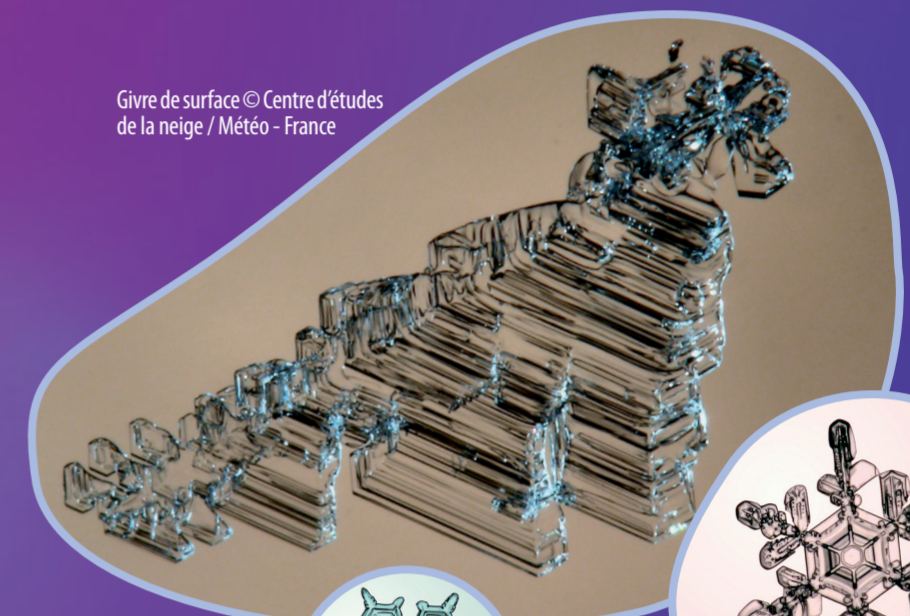
Givre de surface