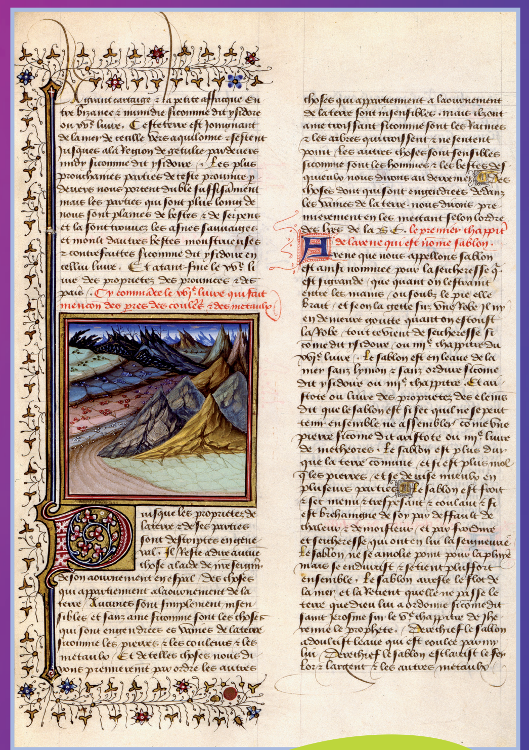
Dans le De Proprietatibus Rerum du franciscain Barthelemy l'Anglais (1230-1240), le livre XVI intitulé De gemmarum traite de quelques 104 pierres, roches et minerais. Cette enluminure qui présente des lits de saphir, rubis et pierres blanches provient d'une des 45 copies manuscrites réalisées aux XIV-XVème siècles à partir de la traduction française de Jean Corbechon (1372).

Les minéraux sont censés soigner le plus souvent par le contact, parfois par l'absorption de poudre de cristal ou en infusion. Pendant l'Antiquité et au Moyen âge, les pierres sont supposées agir dans bien des domaines : il y a ainsi des pierres guérisseuses (petite vérole, variole...), des pierres de folie, des pierres de foudre ou du tonnerre... Ces croyances sont rapportées dans de multiples lapidaires et dans les Almanachs.