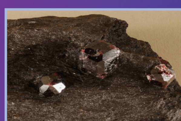
Grenat almandin sur schiste micacé, Fort Wrangell, Alaska, USA.