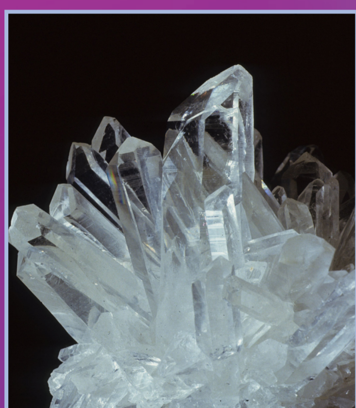
Quartz de la Gardette, Isère, France.