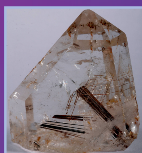
Inclusion de Rutile dans Quartz, Brésil.