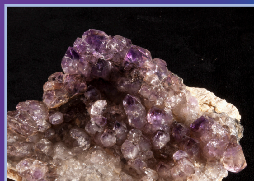
Quartz améthyste, Silver-Star, Montana, USA.