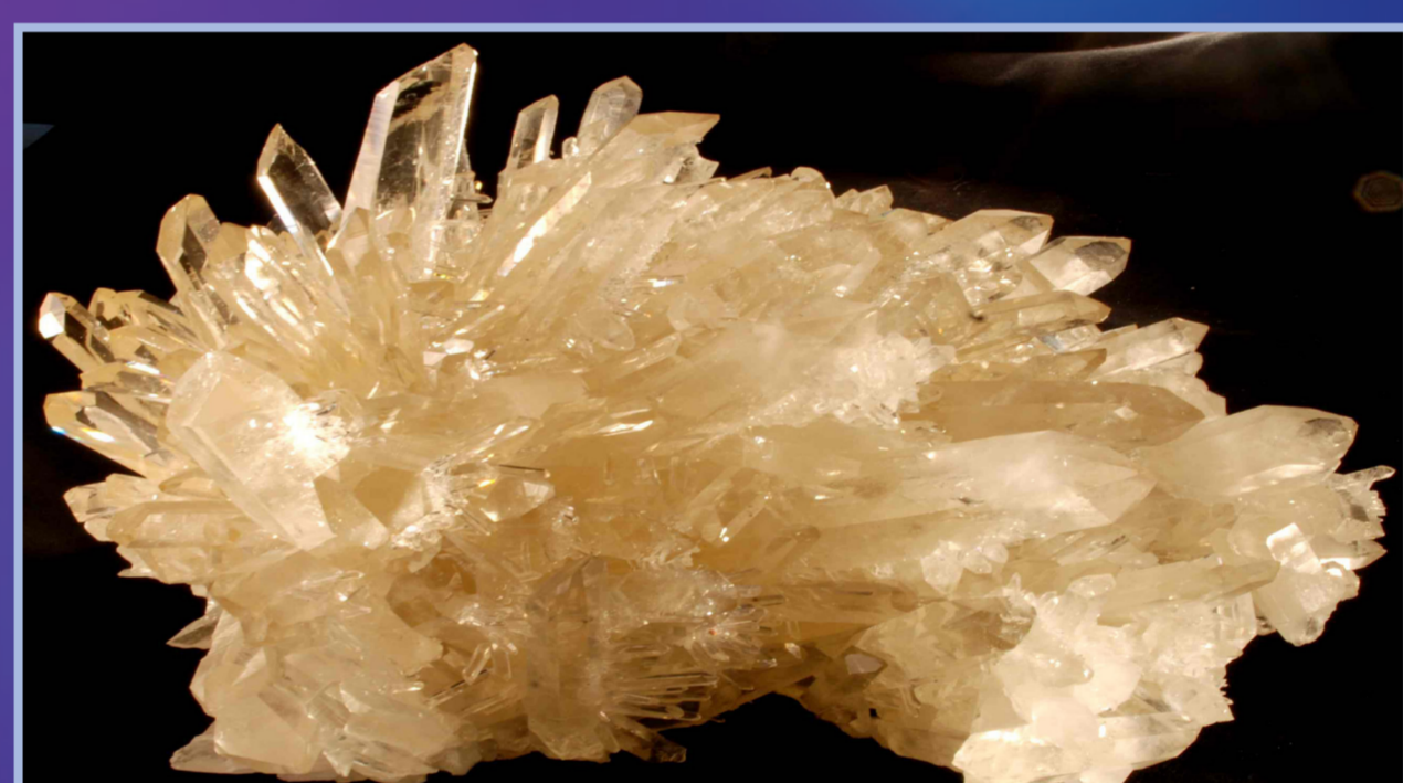
Quartz herisson, Mine de la Gardette, Isère, France.