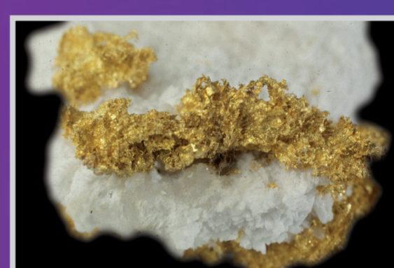
Or natif sur quartz, Mine de la Gardette, Isère, France.

Pur, il est incolore et transparent, c'est le cristal de roche. Il devient coloré en présence d'impuretés : violet pour l'améthyste, jaune pour la citrine.