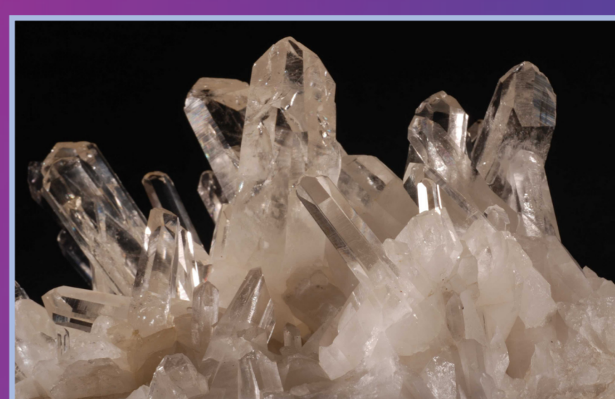
Quartz Cristal de roche, La Gardette, Isère, France.

Le quartz est un constituant majeur des roches de l'écorce terrestre. Il s'observe dans de nombreuses montagnes, en particulier dans les Alpes. C'est de la silice ( \text{SiO}_2 ) cristallisée. Incolore et transparent, il s'appelle «cristal de roche».