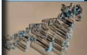
Givre de surface