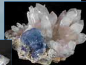
Fluorite bleue