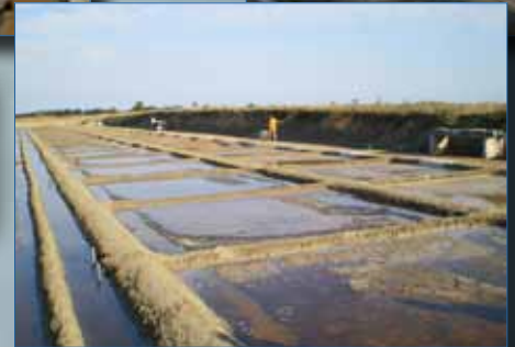
Marais salants, Oléron

La culture de cristaux : les marais salants où l'on obtient la cristallisation du sel par évaporation de l'eau sous l'action combinée du soleil et du vent.