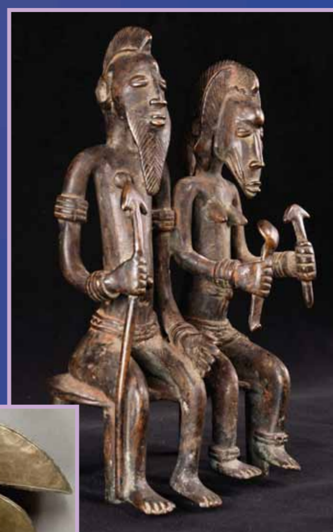
Statuette en bronze (Afrique de l'Ouest), Couteau Danakil, acier (Ethiopie), Reliquaire Kota, laiton et cuivre (Gabon) Coll. Muséum de Grenoble

Les premières traces de la métallurgie remontent à l'utilisation du bronze il y a 5000 ans au moyen orient. Vers -1200 ans, on découvre en Anatolie que le fer chauffé avec du charbon est plus dur que le bronze. Ce n'est qu'au début du 19e siècle que de nouveaux métaux comme l'aluminium sont isolés. De nombreux progrès dans le traitement des métaux ferreux font de ce siècle également «l'âge d'or» des aciers (qui contiennent du fer avec un peu de carbone).