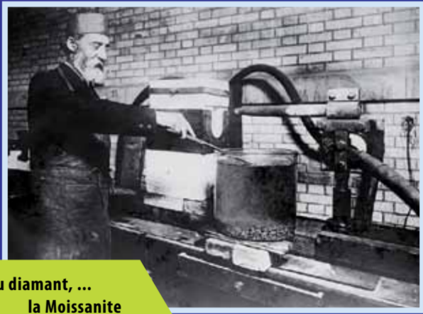
Henri Moissan essayant de fabriquer du diamant dans son laboratoire

A l'aube du 20e Siècle les rayons X permettent de découvrir la structure intime du diamant et du graphite, elles sont très différentes.