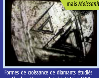
Formes de croissance de diamants étudiés par Charles et Georges Friedel.

Structure du Diamant et structure du graphite Dès 1913, les premières expériences des Bragg «voient» l'intérieur du diamant et déterminent les distances entre les plans d'atomes de carbone. - En 1921 Bernal, chercheur au même laboratoire que Bragg, élucide la structure du graphite. - En 1930, Pauling explique le paradoxe de ces faux-jumeaux : Les liaisons de carbone ne sont pas immuables, elles peuvent se combiner de différentes façons, c'est l'hybridation des orbitales. Dans le diamant, chaque atome de carbone est lié à 4 autres atomes de carbone, situés à une égale et courte distance, qui forment un tétraèdre. Ces liaisons courtes, et donc fortes, donnent au diamant une structure compacte, solide, dense et dure. Au contraire dans le graphite, les atomes de carbone ne sont fortement liés qu'à 3 voisins de carbone dans un plan, ils forment des feuilles solides qui ne sont pas accrochées entre elles et qui se délitent facilement (c'est cette propriété qui nous permet d'écrire avec une mine de crayon).