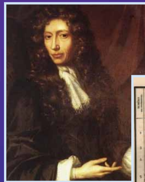
Robert Boyle (1627-1691)

Au 1er siècle, Pline l'Ancien écrit que le diamant est non seulement résistant au feu, mais en plus les feux les plus vifs ne parviennent même pas à le chauffer (car il transmet la chaleur). Aussi, c'est contre toute attente, qu'au milieu du 17e siècle le savant anglais Boyle découvre, sans comprendre, que le diamant «s'évapore» sous l'influence d'une grande chaleur. Jusqu'au 19e siècle, les expériences, menées notamment par Darcet, Lavoisier et ensuite par Friedel, se multiplient afin de comprendre le mécanisme de cette transformation.