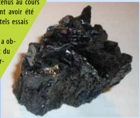
Cristaux artificiels de Moissanite

A la quête du diamant, ... la Moissanite Jusqu'au milieu du 20e siècle, de multiples expériences sont faites en utilisant les fortes pressions pour essayer d'obtenir artificiellement du diamant. Ce fut un peu comme la «pierre philosophale des savants», Hannay et Moissan ont cru avoir réussi cette transformation, mais... - les diamants, trouvés dans les échantillons obtenus au cours des expériences explosives de Hannay, semblent avoir été mis par les ouvriers qui voulaient arrêter de tels essais dangereux. - Moissan, prix Nobel de Chimie en 1906, a obtenu des cristaux très durs, mais c'était du Carbone de Silicium SiC : appelé désormais Moissanite.