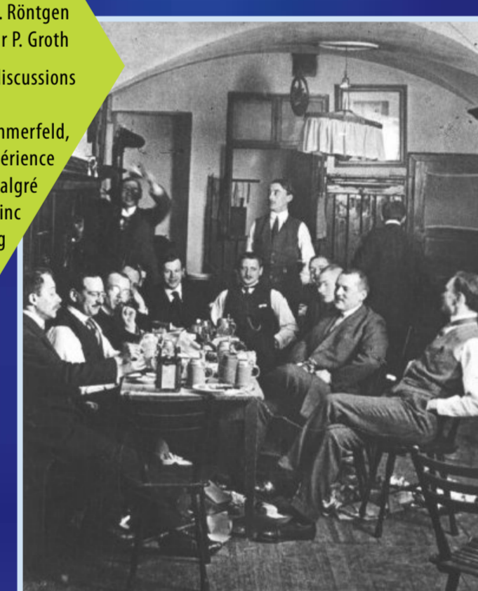
Discussion scientifique au café autour de quelques bières ; sur cette photo, M. Laue est le premier à gauche, W. Friedrich au bout de la table avec une veste foncée et P. Ewald le dernier à droite.