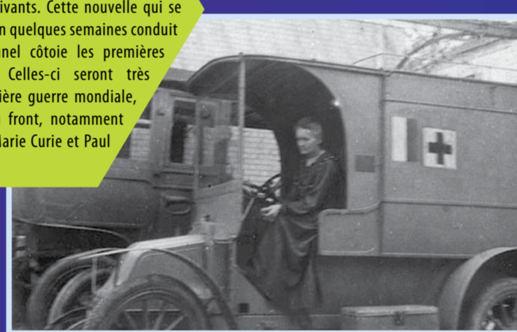
Marie Curie au volant d'une des «petites Curie» lors de la 1 re Guerre mondiale.

Cette radio de la main de la femme de Röntgen montrant la bague et... les os dans un corps vivant bouleverse le monde de cette fin du XIXème siècle: les rayons de Röntgen permettent de voir le squelette des hommes vivants. Cette nouvelle qui se répand sur tous les continents en quelques semaines conduit à une frénésie où l'irrationnel côtoie les premières radiographies médicales. Celles-ci seront très utilisées durant la première guerre mondiale, de part et d'autre du front, notamment grâce à l'action de Marie Curie et Paul Peter Ewald.