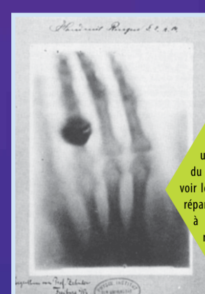
Premier cliché radiographique de Röntgen, 1895.