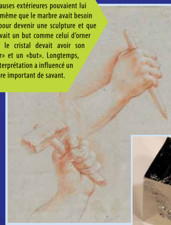
Trois mains tenant des outils de sculpteur. Cristal de Pyrite, Alcarama, Rioja, Espagne.

Selon Aristote, la matière inerte, associée aux minéraux, est une cause matérielle qui ne pouvait pas avoir de formes propres. Seules des causes extérieures pouvaient lui en donner. De même que le marbre avait besoin d'un sculpteur pour devenir une sculpture et que la sculpture avait un but comme celui d'orner un temple, le cristal devait avoir son « sculpteur » et un « but ». Longtemps, cette interprétation a influencé un nombre important de savants.