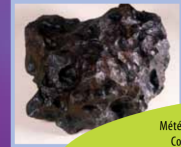
Les pierres du ciel / Céramiques , Météorite (Octahédrite IAB), Campo del Cielo, Argentine Coll. Muséum d'histoire Naturelle de Grenoble Hache polie , roche verte, Saint-Egrève, Néolithique De telles haches néolithiques ont pu devenir «pierres de foudres» investies de propriétés magiques. Les outils de la préhistoire ne furent reconnus comme tels que bien après le XVIIIème siècle. Coll Musée Dauphinois