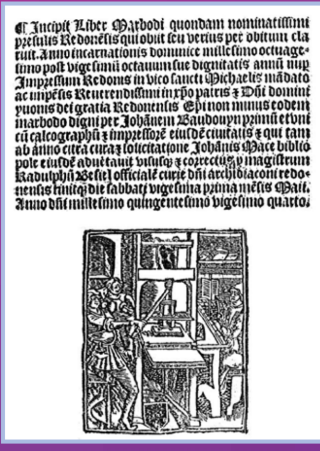
De Gemmarum lapidumque , copie de 1539 Le plus célèbre des lapidaires médiévaux est le De lapidibus de l'évêque Marbode de Rennes (1035-1123) ; sa renommée fut telle que sur les 616 manuscrits lapidaires des bibliothèques d'Europe, 125 sont des copies de celui de Marbode. S'appuyant sur des sources grecques et latines il expose « la vertu » propre à chaque pierre et un supposé usage médical. Quelques exemples de ces « vertus » et croyances du Moyen-Âge : * l'agate trompe la soif et est bonne pour la vue ; * le jaspe est souverain contre la fièvre ; * le saphir rajeunit le corps, met à l'abri de l'erreur, rassure les âmes craintives et apaise les colères du ciel ; * l'émeraude est utile aux dévins et aux avocats et rend la raison aux insensés ; * le beryl est utilisé contre les troubles du foie et pour éviter les rots intempestifs ; * l'améthyste évite l'ébriété. * l'hémattite est un bon remède pour la diarrhée. * le corail fait fuir les monstres