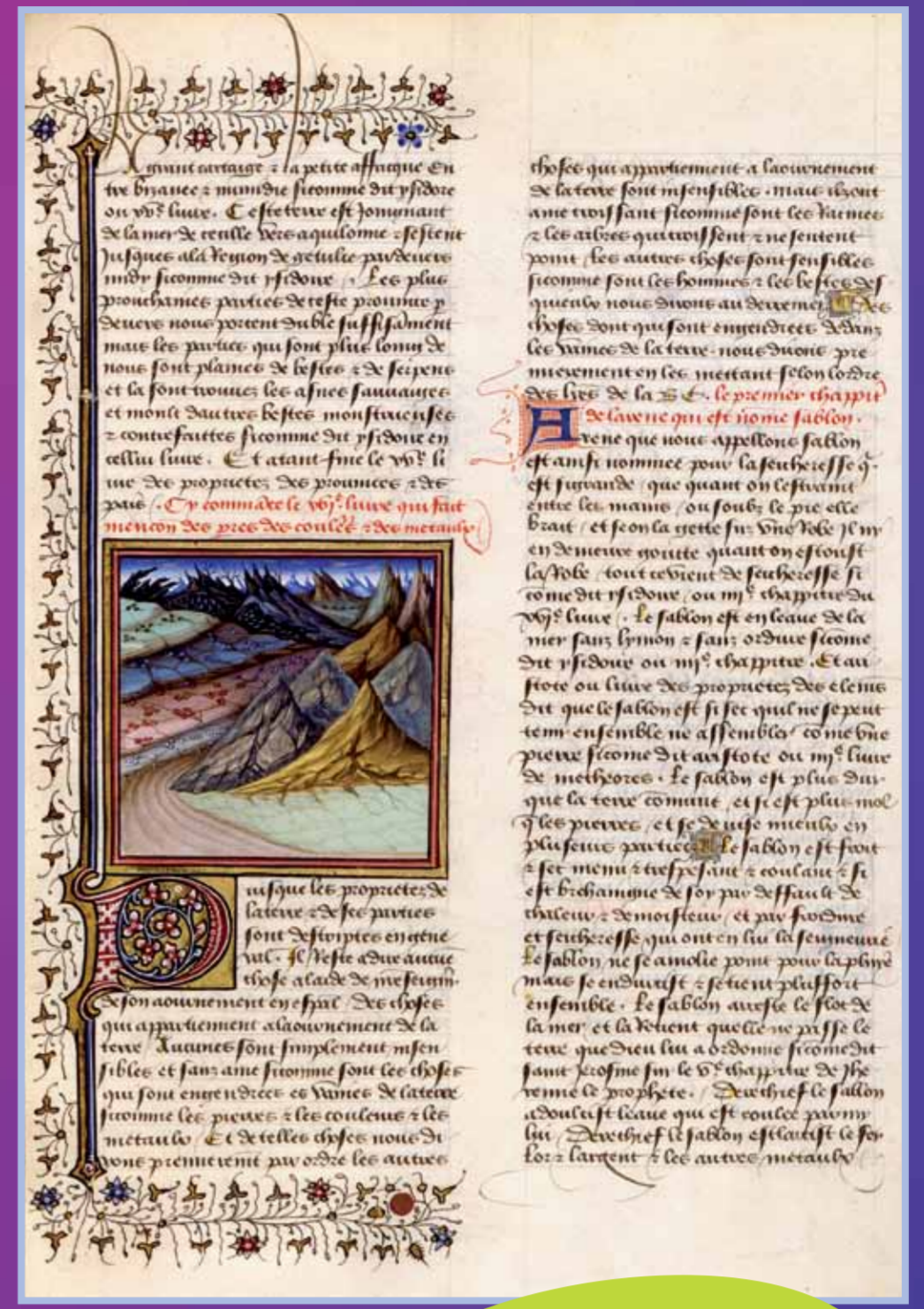
Dans le De Proprietatibus Rerum du franciscain Barthélemy l'Anglais (1230-1240), le livre XVI intitulé De gemmarum traite de quelques 104 pierres, roches et minerais. Cette enluminure qui présente des lits de saphir, rubis et pierres blanches provient d'une des 45 copies manuscrites réalisées aux XIV-XVème siècles à partir de la traduction française de Jean Corbechon (1372).

Les minéraux sont censés soigner le plus souvent par le contact, parfois par l'absorption de poudre de cristal ou en infusion. Pendant l'Antiquité et au Moyen âge, les pierres sont supposées agir dans bien des domaines : il y a ainsi des pierres guérisseuses (petite vérole, variole...), des pierres de folie, des pierres de foudre ou du tonnerre... Ces croyances sont rapportées dans de multiples lapidaires et dans les Almanachs.