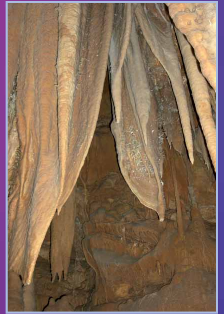
Cristaux de calcite dans une Grotte des Causses

Dès la Préhistoire, les hommes fabriquent des outils en pierre dure provenant de leur environnement proche. C'est le cas du quartz et de l'abondant silex.