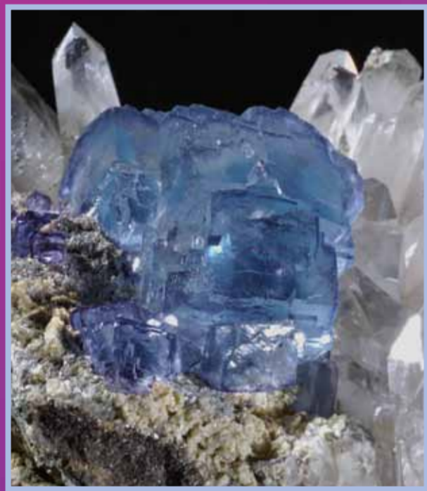
Fluorite bleue sur quartz, Mine de Yaogangxian, Chine

Certaines pierres évoquent des animaux ou des plantes, d'autres ressemblent à des colonnes, des buissons, des boules, des grappes ou des rognons. D'autres sont plus surprenantes, elles présentent des faces planes. Ces formes angulaires sont naturelles. Elles tapissent les parois des cavités souterraines appelées géodes, cryptes ou fours.