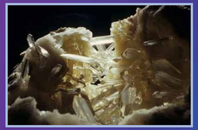
Gypse, Saragosse, Espagne