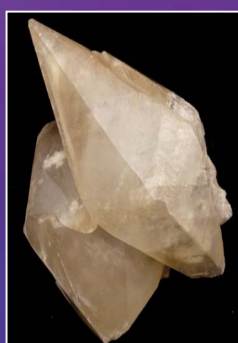
Calcite - Isère

Cette analogie entre le cristal de roche et d'autres matériaux transparents se retrouve dans le verre en « cristal »... qui n'est pas un cristal, mais un verre riche en plomb