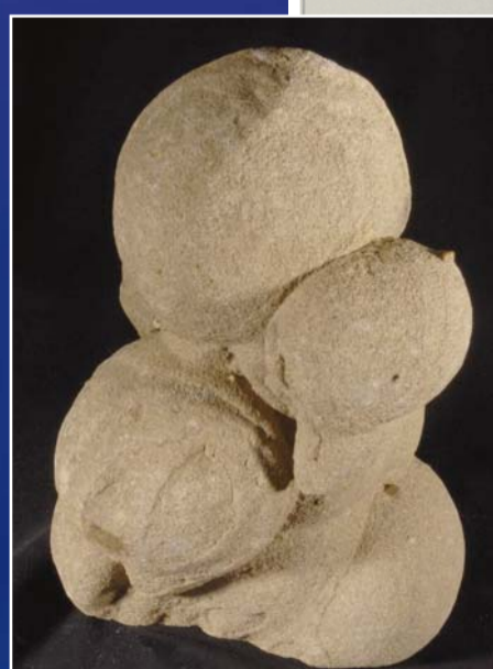
Calcite - St Marcellin Isère