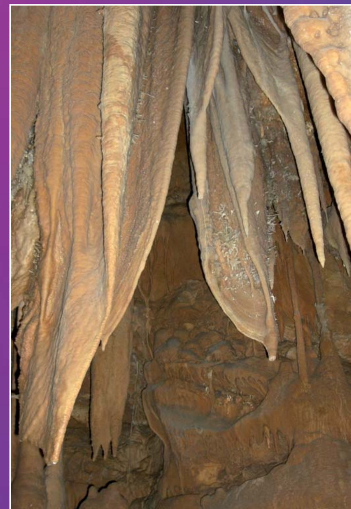
Pierres et cristaux de grottes aux formes multiples.

A la Renaissance, elle seront parfois appelées « les étoiles du monde inférieur ».