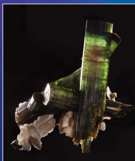
Elbaite, © Muséum d'Histoire Naturelle de Grenoble